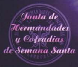
SAN JUAN EVANGELISTA