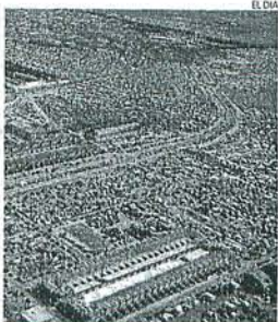
Imagen aérea del Festival Viñarock de Villarrobledo.

-Escenario Villarrobledo-Quijote: rock arte-nativo español -Escenario Naranja: fusión y mestizaje -Escenario Metálka: el mejor he-